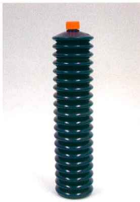
400g 蛇腹式カートリッジ