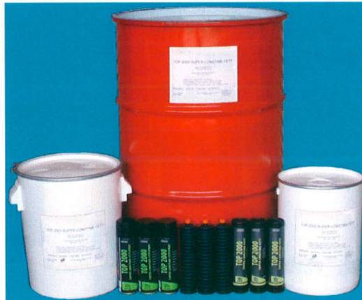
15kg ベール缶、25kg ベール缶、180kg ドラム 400g 筒型カートリッジ、400g 蛇腹カートリッジ